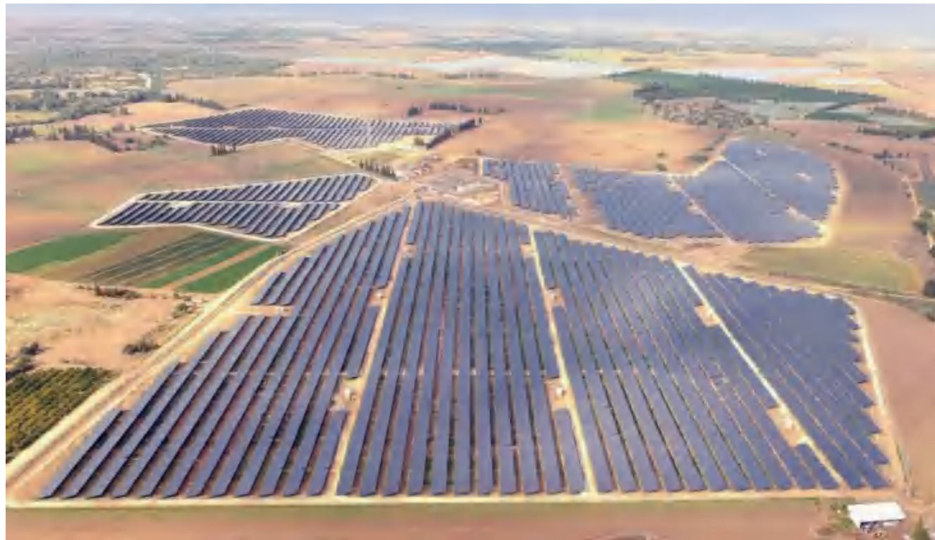
• 90 MWp 以色列,阿拉瓦沙漠,凯图拉