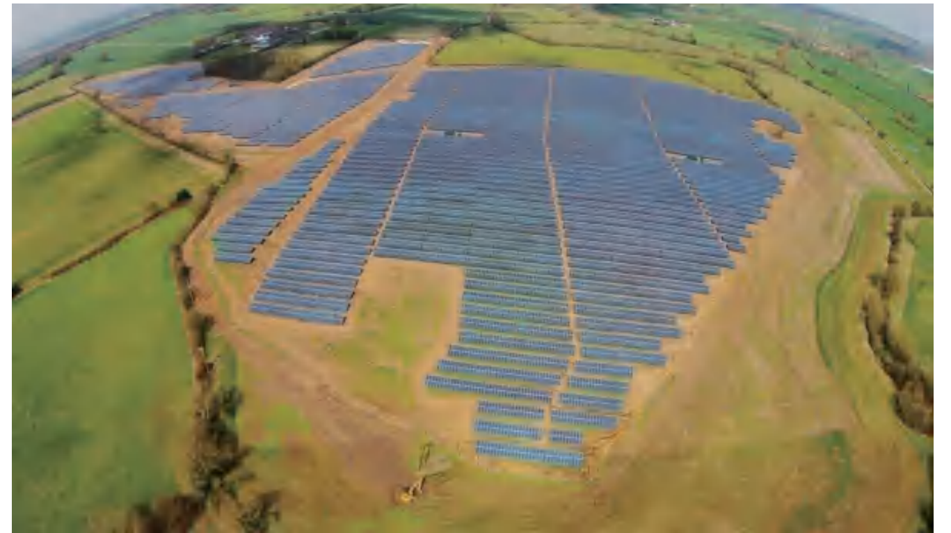
• 13 MWp 英国,莱斯特郡帕克,农场