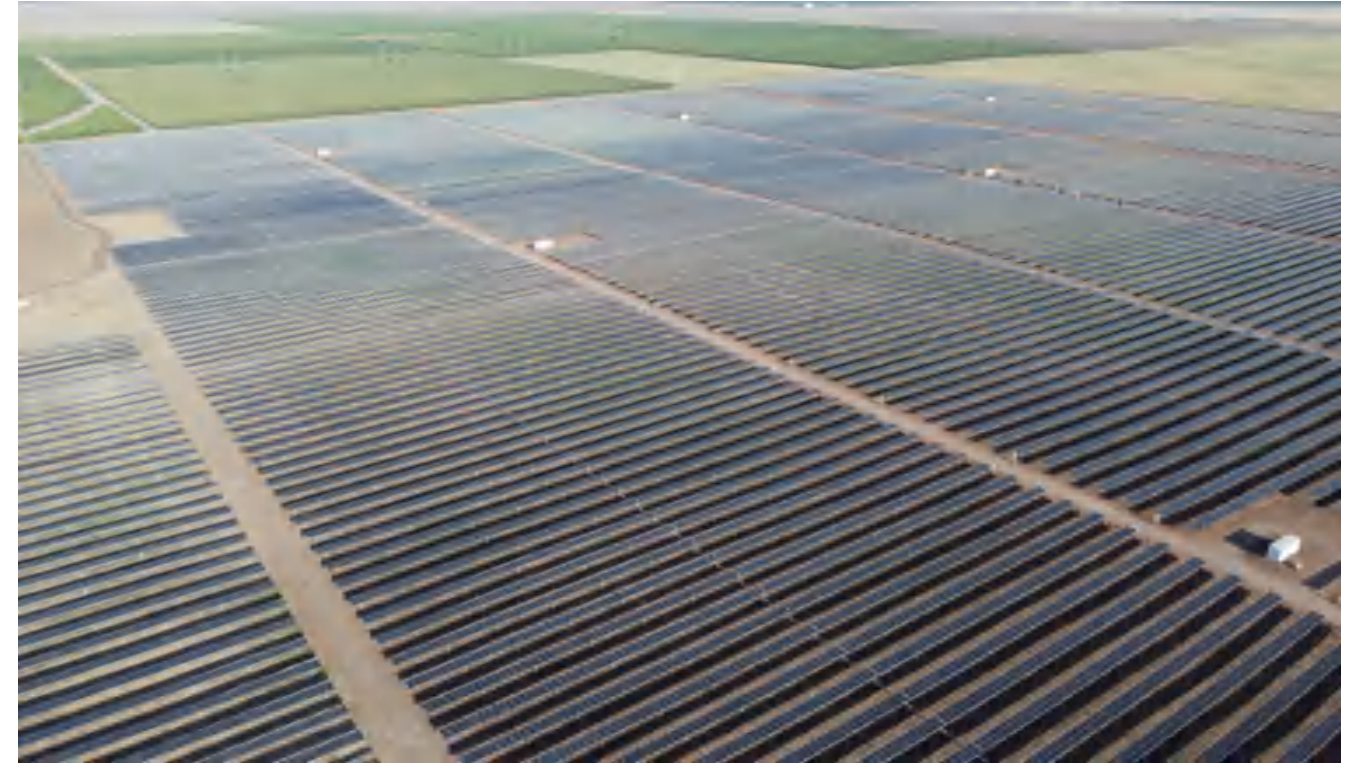
• 73MWp 美国,加利福尼亚州,图莱里