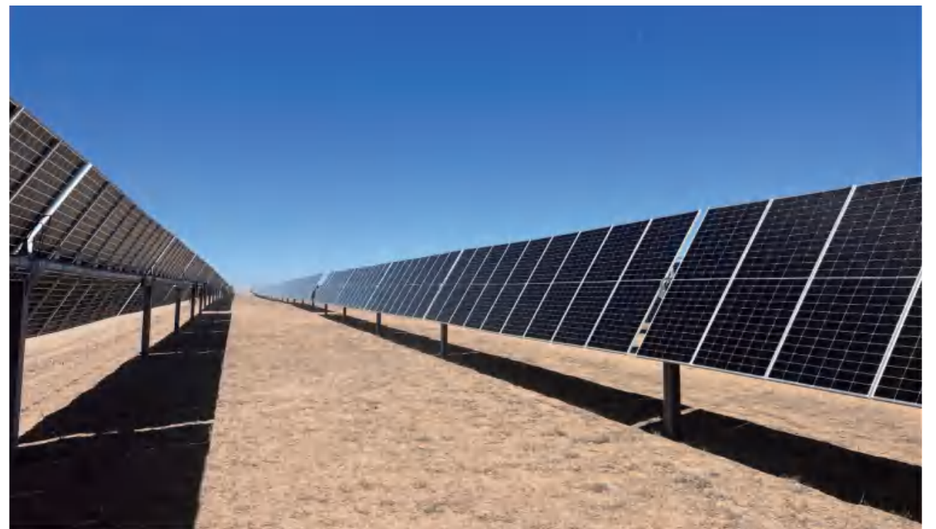
• 242 MWp 美国, 犹他州