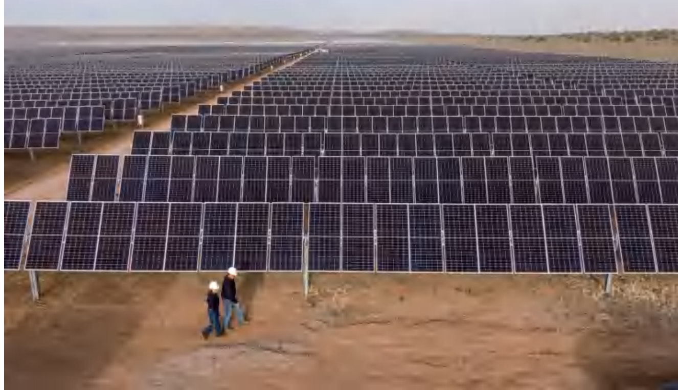
• 63 MWp 美国,新墨西哥州