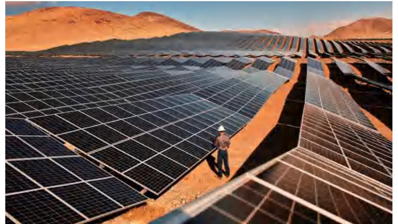
• 62 MWp 美国, 内华达州